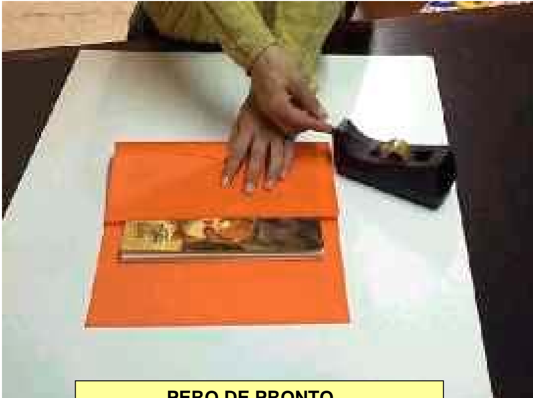
PERO DE PRONTO...